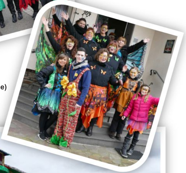
Die Schnattergäns (Motiv Schmetterlinge)