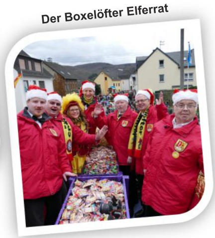
Der Boxelöfter Elferrat