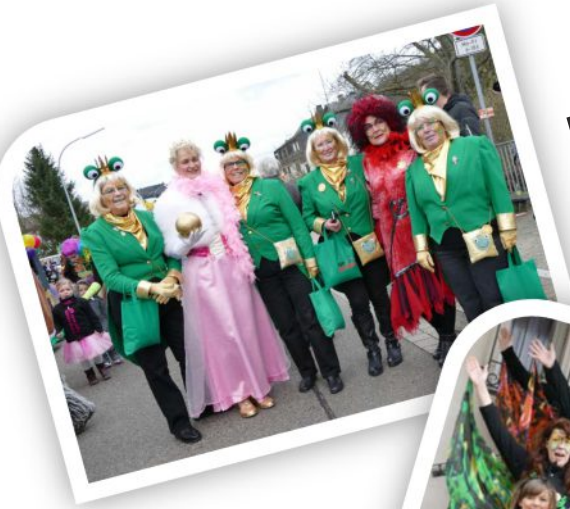
Fidele Mädcher Gruppe "Möhnen mit Herz" (Motiv Froschkönig)